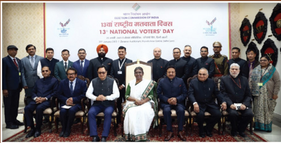
ബഹു. രാഷ്ട്രപതി തിരഞ്ഞെടുപ്പ് കമ്മീഷണർ എന്നിവർക്കൊപ്പം ദേശീയ തലത്തിൽ മികച്ച തിരഞ്ഞെടുപ്പ് പ്രവർത്തനങ്ങളുടെ അവാർഡ് ജേതാക്കൾ

എല്ലാ വർഷവും ജനുവരി 25 ഇന്ത്യൻ തിരഞ്ഞെടുപ്പ് കമ്മീഷൻ ദേശീയ സമ്മതിദായക ദിനം ആഘോഷിക്കുന്നു. ദേശീയ, സംസ്ഥാന, ജില്ല, ബുക്ക് തലങ്ങളിൽ നടത്തുന്ന പരിപാടിയിലൂടെ തിരഞ്ഞെടുപ്പ് പങ്കാളിത്തവും, അവബോധവും പ്രോത്സാഹിപ്പിക്കുകയാണ് ലക്ഷ്യം. തിരഞ്ഞെടുപ്പ് പ്രാധാന്യം തിരിച്ചറിയുന്നതിനായി രാജ്യമെമ്പാടും നടത്തിയ ആഘോഷങ്ങളുടെ ചില ചിത്രങ്ങളാണ് ചുവടെ.