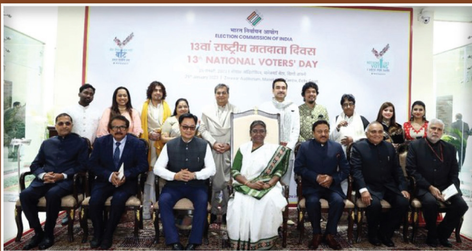
ബഹു. രാഷ്ട്രപതി, തിരഞ്ഞെടുപ്പ് കമ്മീഷണർ എന്നിവർക്കൊപ്പം ECI ഗാനത്തിലെ പ്രമുഖർ