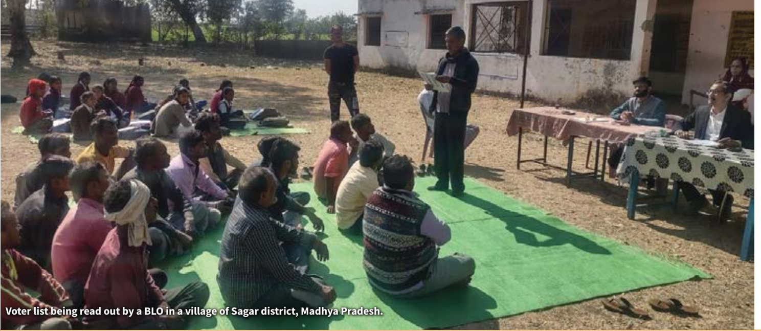
Voter list being read out by a BLO in a village of Sagar district, Madhya Pradesh.