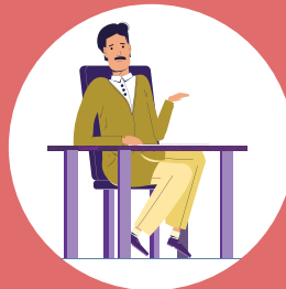
AC Y ന്റെ ERO ആവശ്യമായ നടപടി സ്വീകരിക്കും

BLO ഉചിതമായ ഓഫ്ഷർ തിരഞ്ഞെടുത്ത് അഭിപ്രായം രേഖപ്പെടുത്തുക