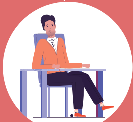
AC X ലെ ERO PSE / DSE ആരംഭിക്കുന്നു

BLO ഉചിതമായ ഓഫ്ഷർ തിരഞ്ഞെടുത്ത് അഭിപ്രായം രേഖപ്പെടുത്തുക