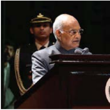
മുൻ ഇന്ത്യൻ പ്രസിഡന്റുമാർ ദേശീയ വോട്ടേഴ്സ് ദിനത്തിലെ വിവിധ പരിപാടികളിൽ

പുതുതായി എൻറോൾ ചെയ്ത വോട്ടർമാർക്ക് അനുഭാവന ചടങ്ങിൽ 'ഒരു വോട്ടർ ആയതിൽ അഭിമാനിക്കുന്നു- വോട്ട് ചെയ്യാൻ തയ്യാറാണ്' എന്ന മുദ്രവാക്യം അടങ്ങിയ ബാഡ്ജും നൽകി. ഫോട്ടോ പതിച്ച തിരിച്ചറിയൽ കാർഡ് നൽകിയതിനോടൊപ്പം പ്രതിജ്ഞയും ചൊല്ലിക്കൊടുത്തു.