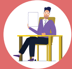
AC Z ന്റെ ERO ആവശ്യമായ നടപടി സ്വീകരിക്കും

ബിഎൽഒ നൽകുന്ന വിവരം അനുസരിച്ച്, ഇന്റേർ ആവശ്യമായ നടപടി സ്വീകരിക്കുക